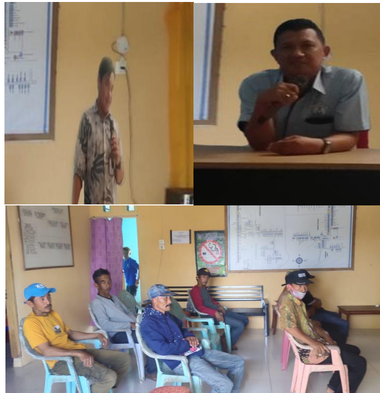
Gambar 4. Pemaparan Materi Pelatihan oleh Pemateri & Diskusi

Berdasarkan pengamatan menunjukkan bahwa para peserta sangat antusias dalam mengikuti kegiatan pelatihan. Hal ini dapat dilihat dari keberadaan mereka dalam forum mulai dari acara pembukaan sampai selesainya kegiatan. Kemudian beberapa peserta ketika dibuka sesi diskusi memberikan tanggapan bahwa kegiatan ini sangat baik bagi mereka. Menurut peserta pelatihan kegiatan ini telah memberikan banyak manfaat, diantaranya adalah meningkatkan kemampuan mengelola BUMDes, mempermudah mengelola BUMDes.