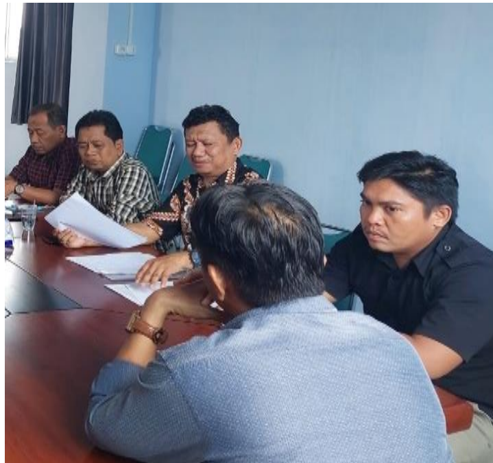
Gambar 1. Rapat tim dosen Persiapan pelaksanaan kegiatan