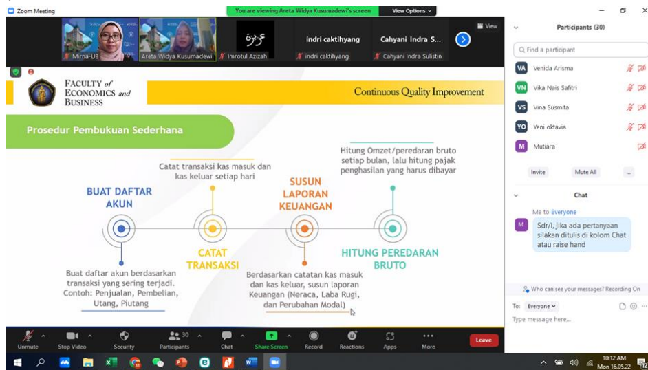
Gambar 2. Narasumber kedua memberikan materi topik Teknis penyusunan laporan keuangan UMKM.

Teknis penyusunan laporan keuangan UMKM. Selanjutnya peserta diberikan pelatihan teknis tentang penyusunan laporan keuangan UMKM berdasarkan SAK EMKM. Mayoritas para peserta belum memahami teknis penyusunan laporan keuangan UMKM sehingga perlu disampaikan topik tersebut. Narasumber memberikan contoh studi kasus mulai dari transaksi-transaksi akuntansi sampai siklus akuntansi meliputi penjumlahan, buku besar, dan laporan keuangan. Hasil dari pelatihan yang telah dilaksanakan adalah mahasiswa memiliki pengetahuan dan pemahaman lebih mendalam terkait teknis penyusunan laporan keuangan UMKM berdasarkan SAK EMKM (lihat Gambar 2). Seperti yang disampaikan oleh Selvi, “dengan mengikuti pelatihan ini, saya memperoleh pengetahuan lebih terkait teknis penyusunan laporan keuangan, terlebih memahami siklus akuntansi seperti transaksi-transaksinya sampai dengan menyusun laporan keuangan UMKM yaitu Neraca dan Laporan laba rugi”.